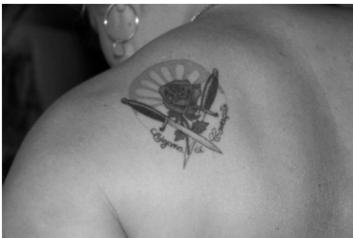
Figura 1: Tatuagem “espírito cigano”

A proposta desse trabalho é debater o que trabalhei como “ciganos de espírito 132 ” (2014:13) na Tzara Ramirez 133 , bem como a necessidade de se reinventar e agregar novos elementos para manter a prática religiosa forte e com vitalidade, procurando questionar como acontece nesse contexto a influência que os médiuns 134 e pacientes 135 da tenda exercem sobre esses eventos ritualísticos e elementos diversos que os circundam.