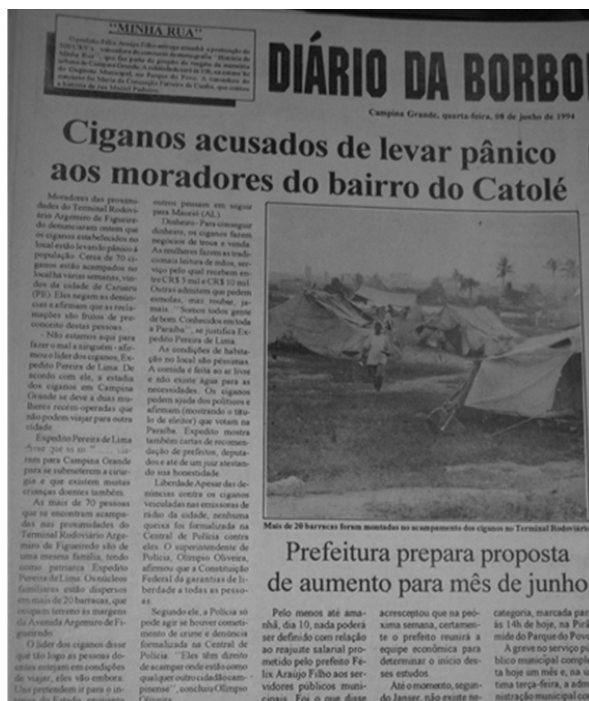
Figura 1: Fotografia do Jornal Diário da Borborema, 08 de junho de 1994.

Como afirma Vianna (1995), essas cartas são também uma forma de instrumentalizar recursos de controle que, aparentemente, não fariam parte de uma administração burocrática, de modo que podem, as cartas, criar ações de rotinização de dominação. As cartas estabelecem não apenas um registro de uma relação de vigilância com os ciganos, mas um caminho pelo qual se legitimam procedimentos como, por exemplo, denúncia da presença de ciganos nos bairros da cidade; de forma a reprimir e acumular informações sobre essas populações, para limitar seu trânsito. Por outro lado, ao mesmo tempo em que se mantinha uma prática, pedagógica, de demonstrar que sendo parte de uma rede de subordinação, é possível se encontrar amparo no mundo.