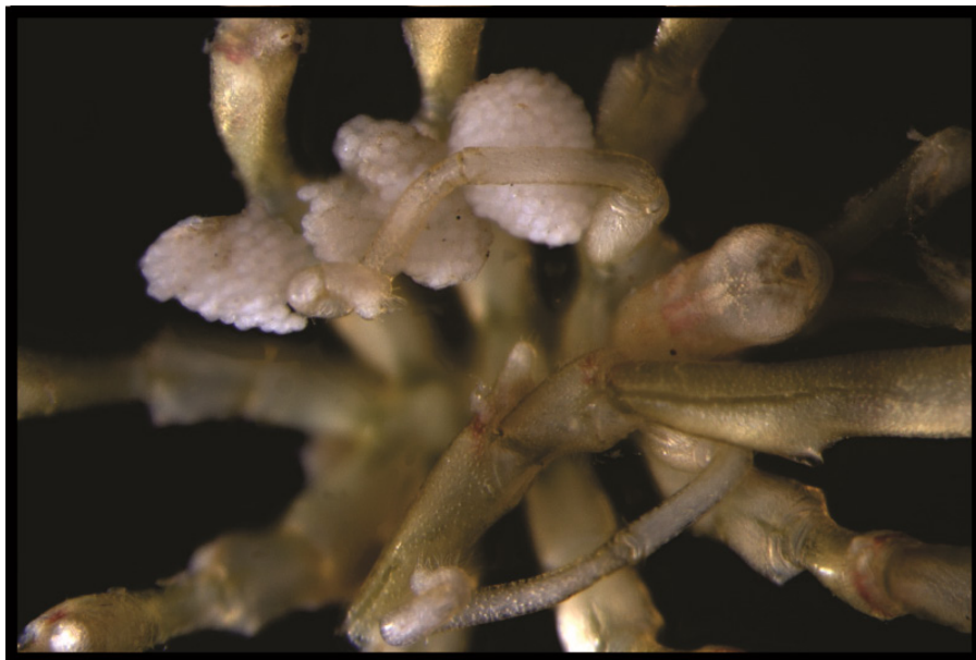
Figura 6: Vista ventral de um macho de Anoplodactylus sp. com ovos aderidos aos ovígeros.

grandes massas de ovos, o que os tornaria mais susceptíveis a predação, sugerindo que o cuidado parental poderia afetar a locomoção e forrageamento do macho, tornando-o mais suscetível à predação (COLE, 1904b; KING, 1973; BAIN, 2003a). Burris (2011a), analisando os custos do cuidado parental exclusivo em Achelia simplissima (Hilton, 1939), observou que havia sim uma diminuição na locomoção dos machos com ovos (apesar de não diminuir o forrageamento), o que acarretou na diminuição da taxa reprodutiva, porém, não houve aumento significativo na predação. Contudo, foi observado um aumento da taxa de epibiose, o que pode acarretar em uma diminuição da mobilidade de um macho, reduzir seu forrageamento, mesmo a longo prazo, já que após adultos os Pycnogonida não fazem mais mudas.