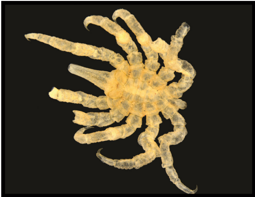
Figura 5: Pentapycnon geaiy Bouvier, 1911, uma espécie polímera.

rência de apêndices supranumerários é única entre os Arthropoda (HEDGPETH, 1982). Tradicionalmente e intuitivamente assumiu-se que estas formas poliméricas, assim como as formas com uma maior quantidade de apêndices cefálicos e artículos destes apêndices, fossem formas mais basais de picnognídeos. Assim, os picnognídeos teriam uma redução gradual dos apêndices, principalmente cefálicos e dos poros genitais (ARANGO, 2002). Segundo Munilla León (1999), esta seria uma “Evolução Regressiva”. Porém, em análises mais recentes (ver ARANGO; WHEELER, 2007) tem sido proposto que essas linhagens evoluíram independentemente nas três famílias. De acordo com este resultado, as formas poliméricas não podem ser seguidas como uma característica compartilhada pelas três diferentes famílias, permanecendo as relações desses grupos, e dos demais, ainda incertas.