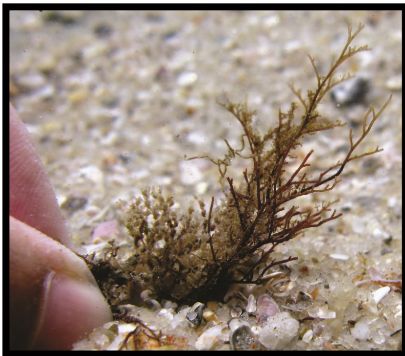
Figura 1: Anoplodactylus sp. em hidrozoários

Apesar do relativamente elevado número de espécies conhecidas, poucos tem sido os estudos com o grupo, não só no Brasil como no mundo (SOUZA; TIAGO, 2011; LUCENA et al. 2015; LUCENA; CHRISTOFFERSEN, 2016). Alguns fatores podem, talvez, justificar o desinteresse de estudos com o grupo, como sua baixa abundância, eficiente camuflagem e tamanho pequeno com formas aberrantes, assim como a ausência de valor econômico (ARANGO, 2003a). As espécies de águas rasas e quentes são particularmente negligenciadas, devido principalmente ao seu tamanho ainda mais reduzido, hábitos crípticos e ocorrências ocasionais (ARANGO; KRAPP, 2007).