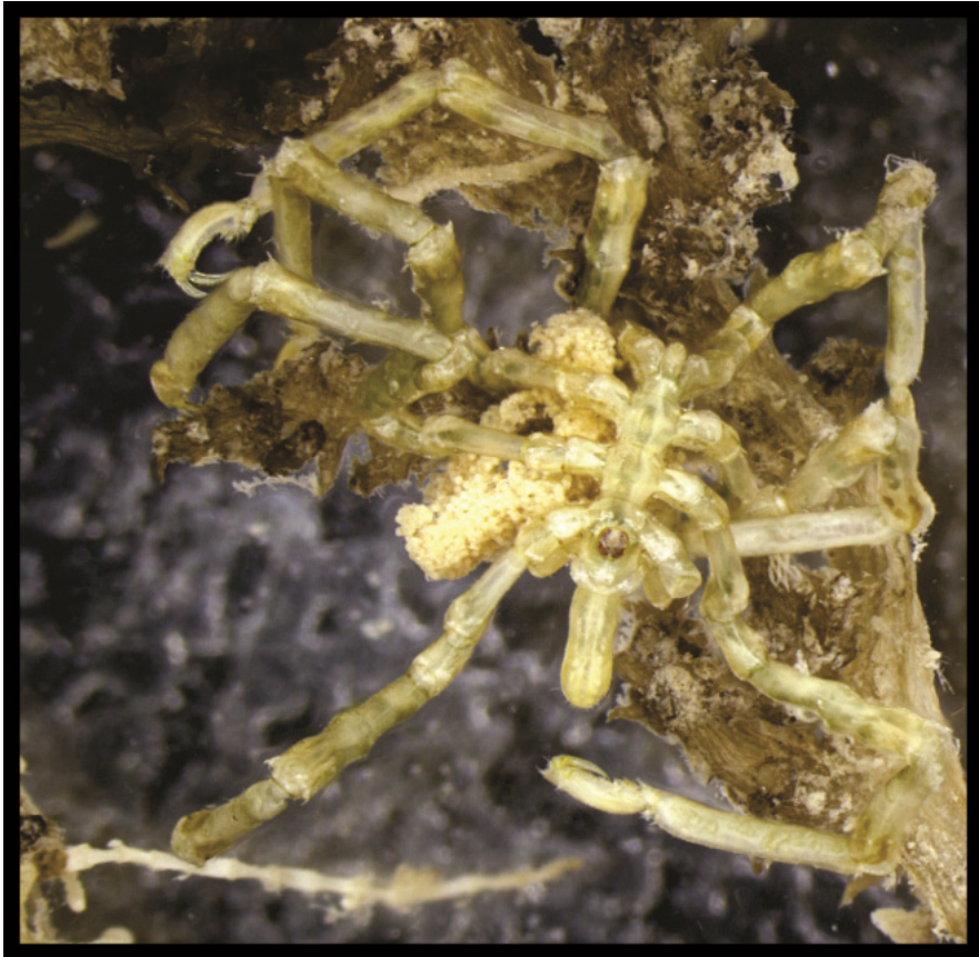
Figura 3: Endeis sp. associado a algas (Foto de Nicolas Eugênio Saraiva).